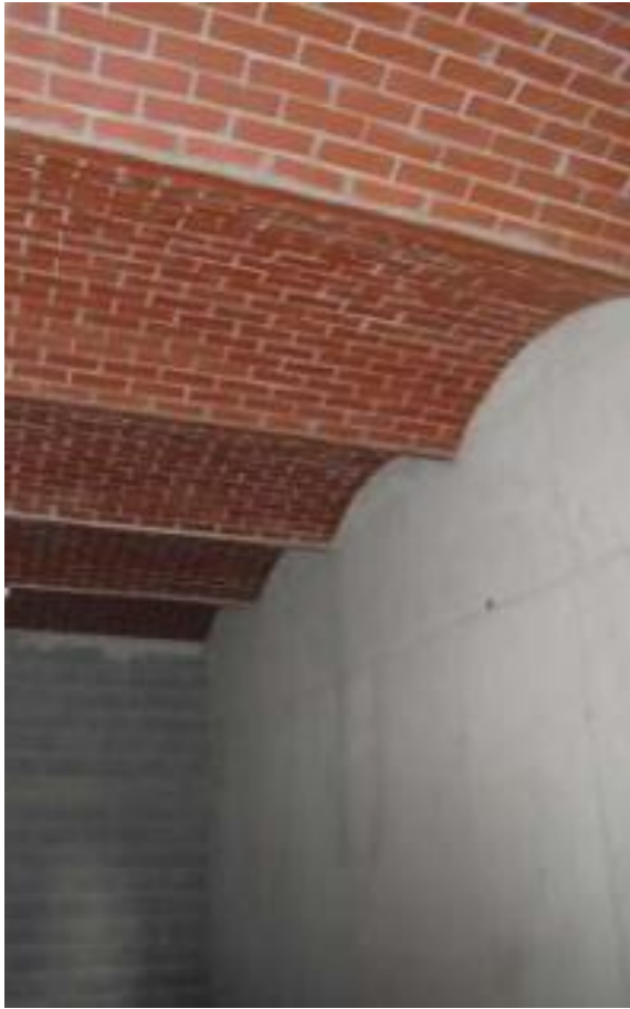
Del kleti je obokan, stropi so visoki